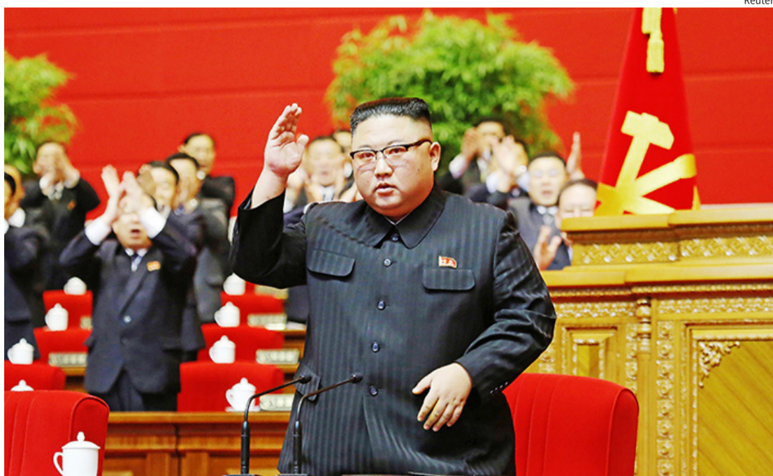
O líder Kim Jong Un já havia solicitado a mudança constitucional para designar a Coreia do Sul como o principal inimigo

A Agência Central de Notícias da Coreia do Norte (KCNA, na sigla em inglês) afirmou que a recente demolição de partes das seções norte das estradas e ferrovias intercoreanas foi "uma medida inevitável e legítima em conformidade com a constituição da Coreia do Norte, que define claramente a Coreia do Sul como um estado hostil".