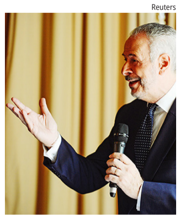
Toni defende transparência