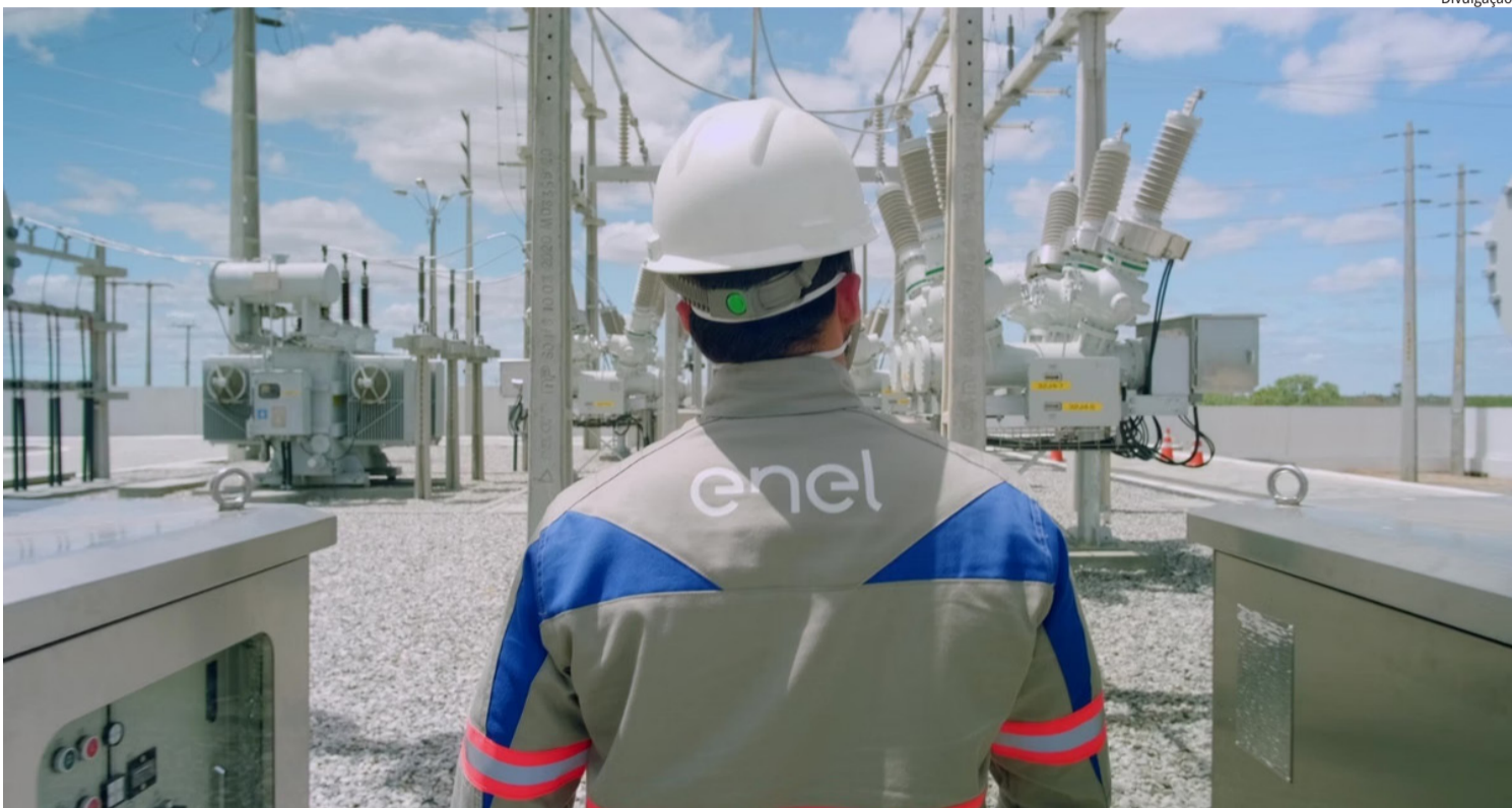
A Enel afirma que mantém o efetivo de profissionais reforçado como medida de prevenção para a nova tempestade prevista para o fim de semana.

A empresa recebeu reforço de profissionais de outras cidades e países para atuar no apagão histórico na Grande de São Paulo, que se deu após forte