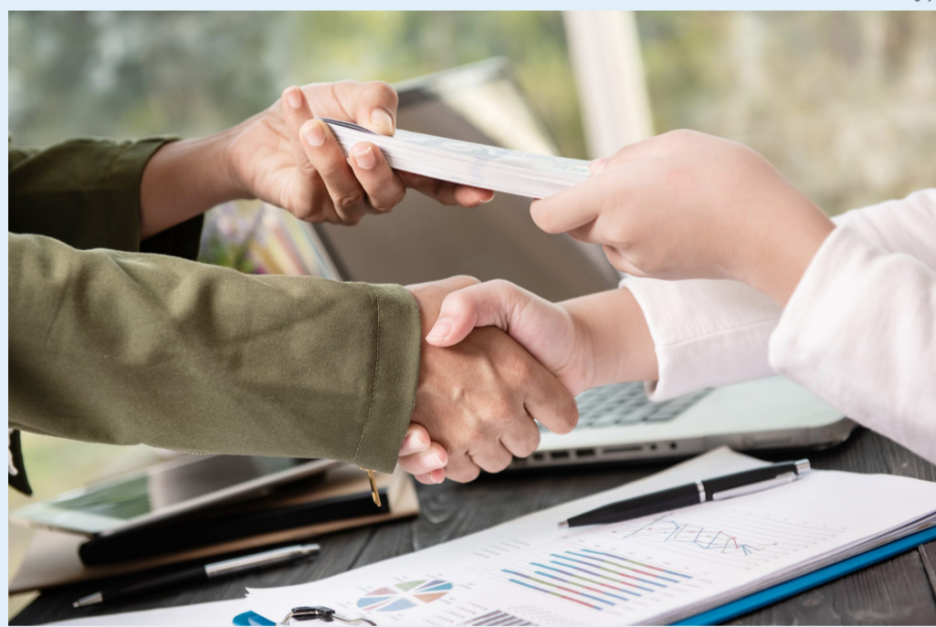
Minas fechou setembro com 8.613 empresas abertas, desempenho 25,54% maior ante setembro de 2023

Denominada "Fase 2 da Redesim", a interface passará a contar com a consulta de viabilidade de localização - o primeiro passo para a abertura de uma empresa - de forma totalmente automatizada. Quanto ao licenciamento, a partir da integração com todos os municípios, o sistema passará a funcionar de forma unificada, possibilitando a troca mútua de informações em tempo real.