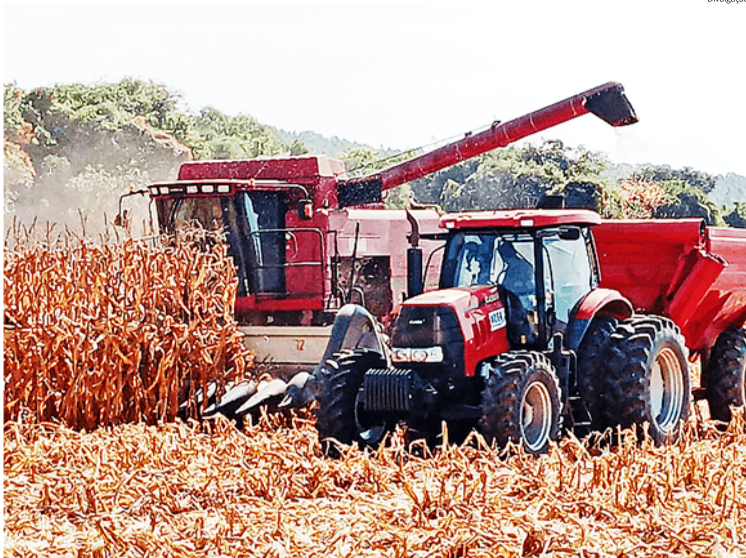
A AgroGalaxy afirmou que o atendimento aos clientes das regiões afetadas pelas mudanças será redirecionado para as unidades mais próximas