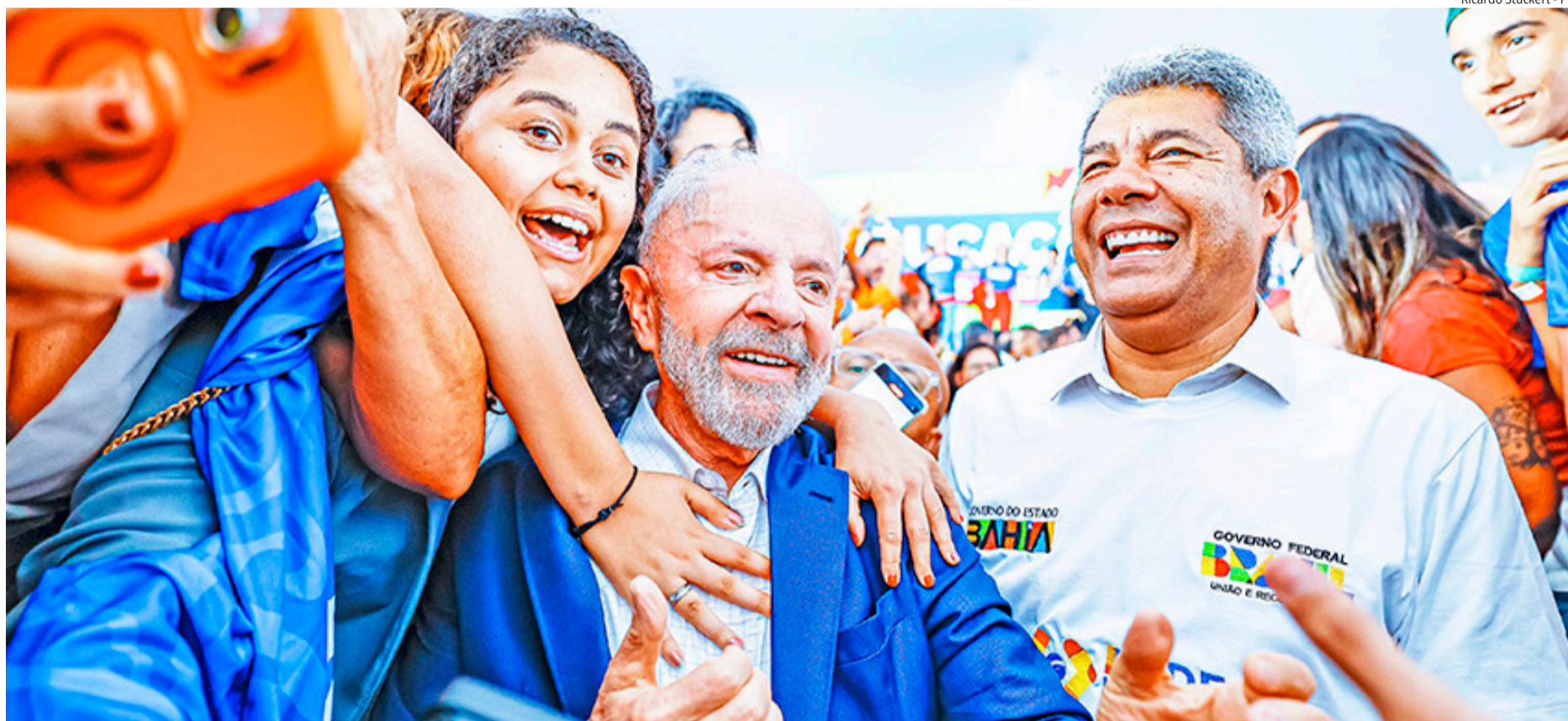
Presidente Lula, durante uma cerimônia de anúncios para Educação na Bahia: “tem muita gente que acha que nós estamos gastando muito dinheiro. Eu não acho que é gasto, acho que é investimento”